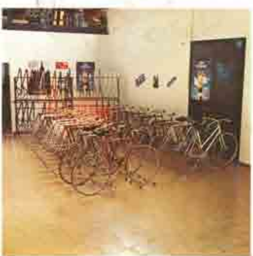
Reparto spedizioni Forwarding department Versandabteilung Département d'expéditions

Lugo di Romagna, Juni 1973: die Freundschaft und Sportbegeisterung mehrerer Personen hat zur Gründung eines Handwerksbetriebes, der in der Fahrradbranche tätig ist, geführt. Bereits nach kurzer Zeit wurde die Wirksamkeit dieser Initiative durch technische Erfolge im In- und Ausland auf dem Gebiet der Rahmen- und Rennradproduktion bestätigt.