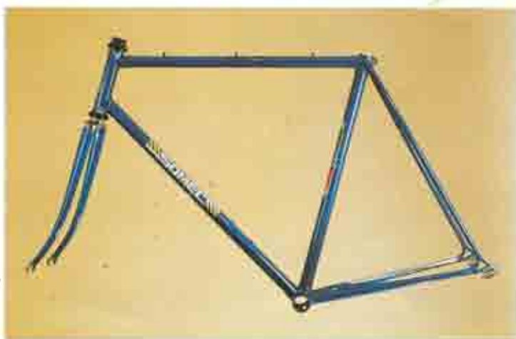
ART. 005 1. Falk - 5. Somec