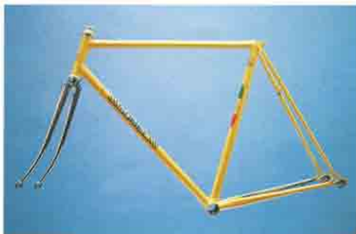
ART. 004 1. Columbus Aelle - 2. Microfuse Somec - 5. Gipiemme