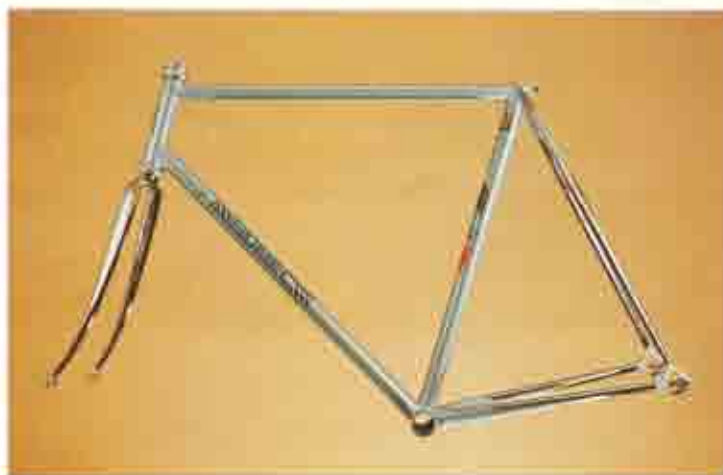
ART. 002 1. Columbus SL e Air - 2. Microfuse Cinelli - 3. Microfuse Cinelli - 4. Microfuse Cinelli - 5. Campagnolo - 6. Columbus