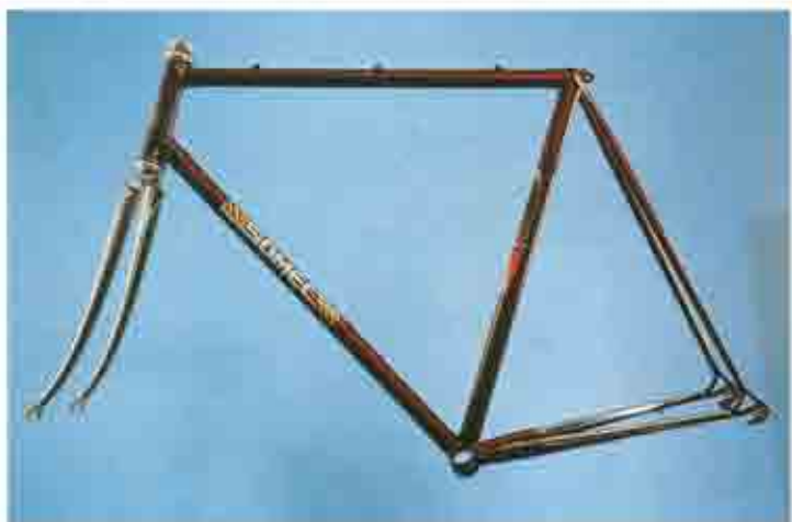
ART. 003 1. Columbus SL - 2. Microfuse Cinelli - 3. Microfuse Cinelli - 5. Campagnolo