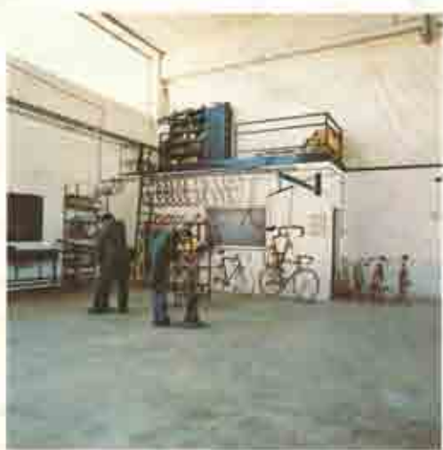
Reparto montaggio Assembly department Abteilung abvieren und feilen Atelier de montage

Brought together through friendship and their love of sports, the founders of Somec established their company in Lugo di Romagna in June of 1973. Their goal then, as it is now, was to manufacture bicycles in a tradition of quality and fine craftsmanship. Recognition of their achievement was soon to come. Within a short time, the technical superiority of Somec's frames and racing cycles was confirmed by successes in Italy and on the international market.