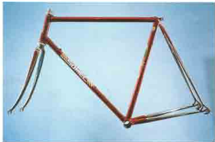
ART. 001 1. Columbus SL e Air - 2. Microfuse Cinelli - 3. Microfuse Cinelli - 4. Microfuse Cinelli - 5. Campagnolo - 6. Columbus