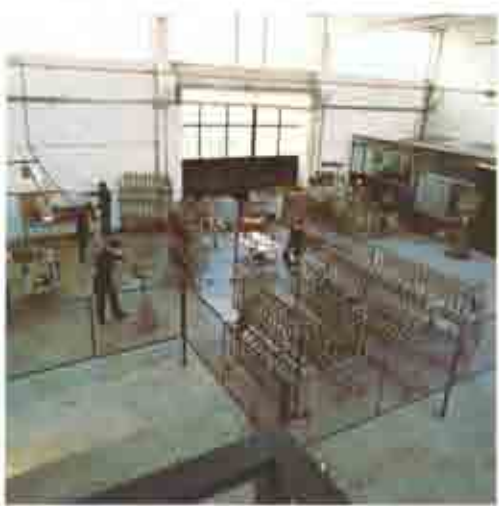
Reparto squadratura e limatura Squaring and filing department Endmontage Atelier de dressage et image

Lugo di Romagna, giugno 1973: L'amicizia e la passione sportiva di alcune persone, portavano al battesimo di una azienda artigiana operante nel settore ciclistico. Nell'evolversi di breve tempo, la validità di questa iniziativa, veniva confermata dai successi tecnici in campo nazionale ed internazionale nella produzione di telai e biciclette da corsa