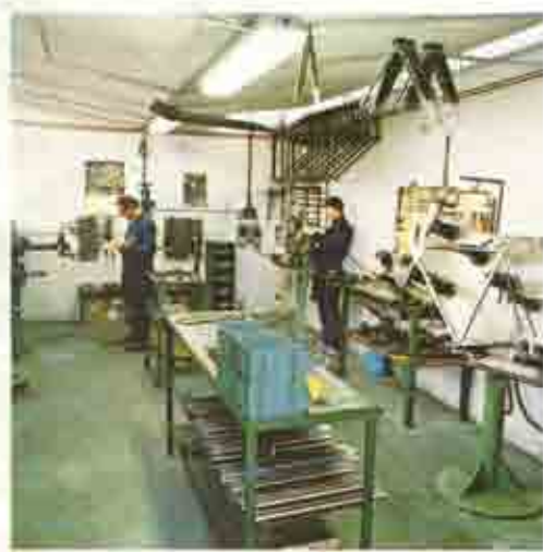
Reparto assemblaggio e saldatura Assembly and welding department Montageabteilung und schweissererei Atelier d'assemblage et soudage